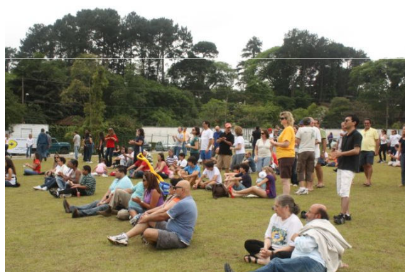
Participaram do evento 250 moradores da região